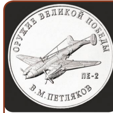
КОНСТРУКТОР ОРУЖИЯ В.М. ПЕТЛЯКОВ 25 рублей / 2019

Легендарный и героический Т-34, созданный советским инженером-конструктором Михаилом Кошкиным, начали производить в 1940 году. Благодаря экономичному дизель-мотору боевая машина получила абсолютное превосходство в проходимости, маневренности и подвижности, значительно повлияв на исход войны.