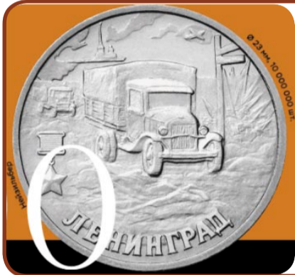
55-я годовщина Победы в Великой Отечественной войне 1941–1945 гг. Ленинград

Всё началось с удивления. В серии «55 годовщина Победы в Великой Отечественной войне 1941-1945г.г. Ленинград» я увидела монету, на ней изображена «полупорка» – да, именно грузовой автомобиль ГАЗ-АА. Я поняла бы, если танк или самолёт, но просто