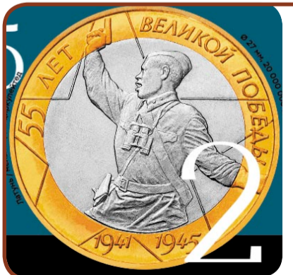
55-я годовщина Победы в Великой Отечественной войне 1941–1945 гг.

А с этой монеты на тебя смотрит женщина. Знакомлюсь с пояснением: «Эта монета посвящена работе женщин в тылу. Сила их духа была настолько велика, что они, не задумываясь, справлялись с огромной физической нагрузкой. В этот тяжелейший период на заводах страны, где, по разным оценкам, более двух третей штата составляли женщины, было произведено около 870 000 единиц боевой техники.»