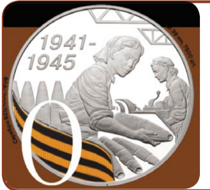
65-я годовщина Победы в Великой Отечественной войне 1941–1945 гг.