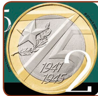
75-летие Победы советского народа в Великой Отечественной войне 1941-1945 гг. 10 рублей / 2019