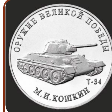
КОНСТРУКТОР ОРУЖИЯ М.И. КОШКИН 25 рублей / 2019

Сдержанность художественного языка и точность деталей – отличительные черты монеты, посвященной конструктору Георгию Шпагину, создателю пулемета-пулемета образца 1941 года. В годы Великой Отечественной войны было выпущено около 6 млн экземпляров этого оружия. Более половины бойцов Красной Армии воевали с пулеметом-пулеметом Шпагина, ласково называя его «папашей».