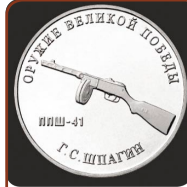
КОНСТРУКТОР ОРУЖИЯ Г.С. ШПАГИН 25 рублей / 2019

Выставка представляет монеты, посвященные конструкторам оружия войны 1941-1945 годов: Георгию Шпагину, создателю пулемета-пулемета образца 1941 года; Михаилу Кошкину, создателю легендарного Т-34; Владимиру Петлякову, конструктору двухмоторного пикирующего бомбардировщика «Пе-2» (знаменитая «пешка»), впервые примененная 22 июня 1941 года.