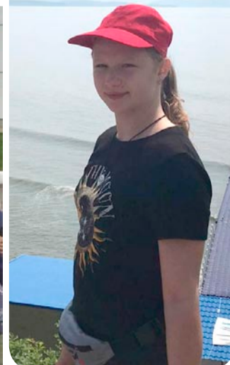
Дружина «Бригантина» 5 28 мая - 17 июня 2021 года

Учредитель газеты – муниципальное бюджетное общеобразовательное учреждение «Центр образования №8 имени Героя Советского Союза Леонида Павловича Тихмянова»