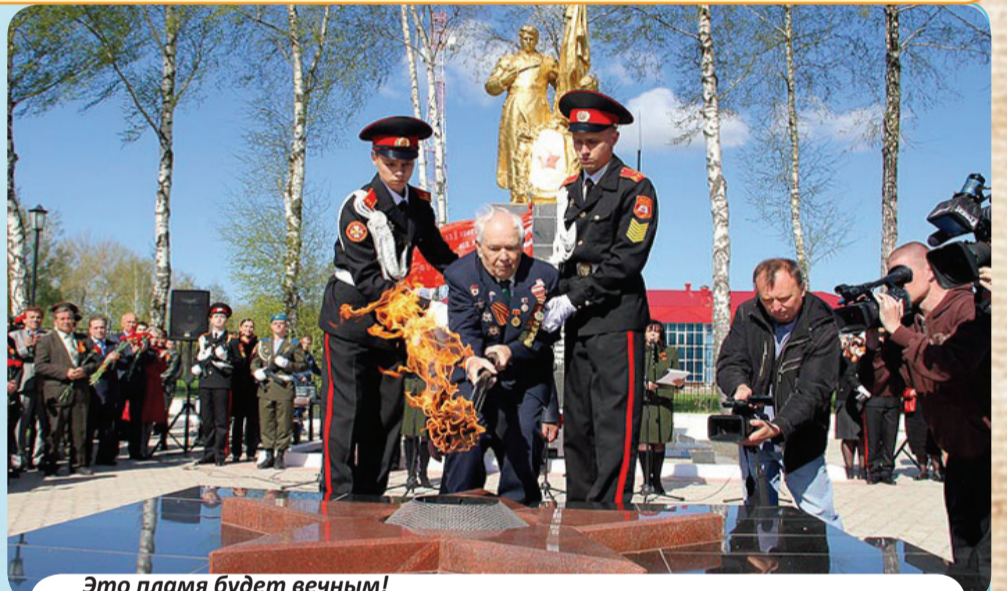
Это пламя будет вечным! В Первомайском вновь зажгли первый в стране Вечный огонь. (06.05.2013 г.)

8 мая 1967 года на месте захоронения был открыт мемориальный архитектурный ансамбль «Могила Неизвестного Солдата» и зажжён Вечный огонь, доставленный из Ленинграда с Марсова поля. Факел нёс легендарный лётчик Герой Советского Союза Алексей Петрович Маресьев, а вечный огонь зажигал Леонид Ильич Брежнев.